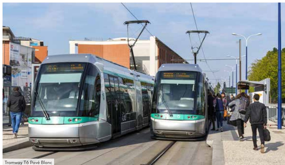
Tramway T6 Pavé Blanc