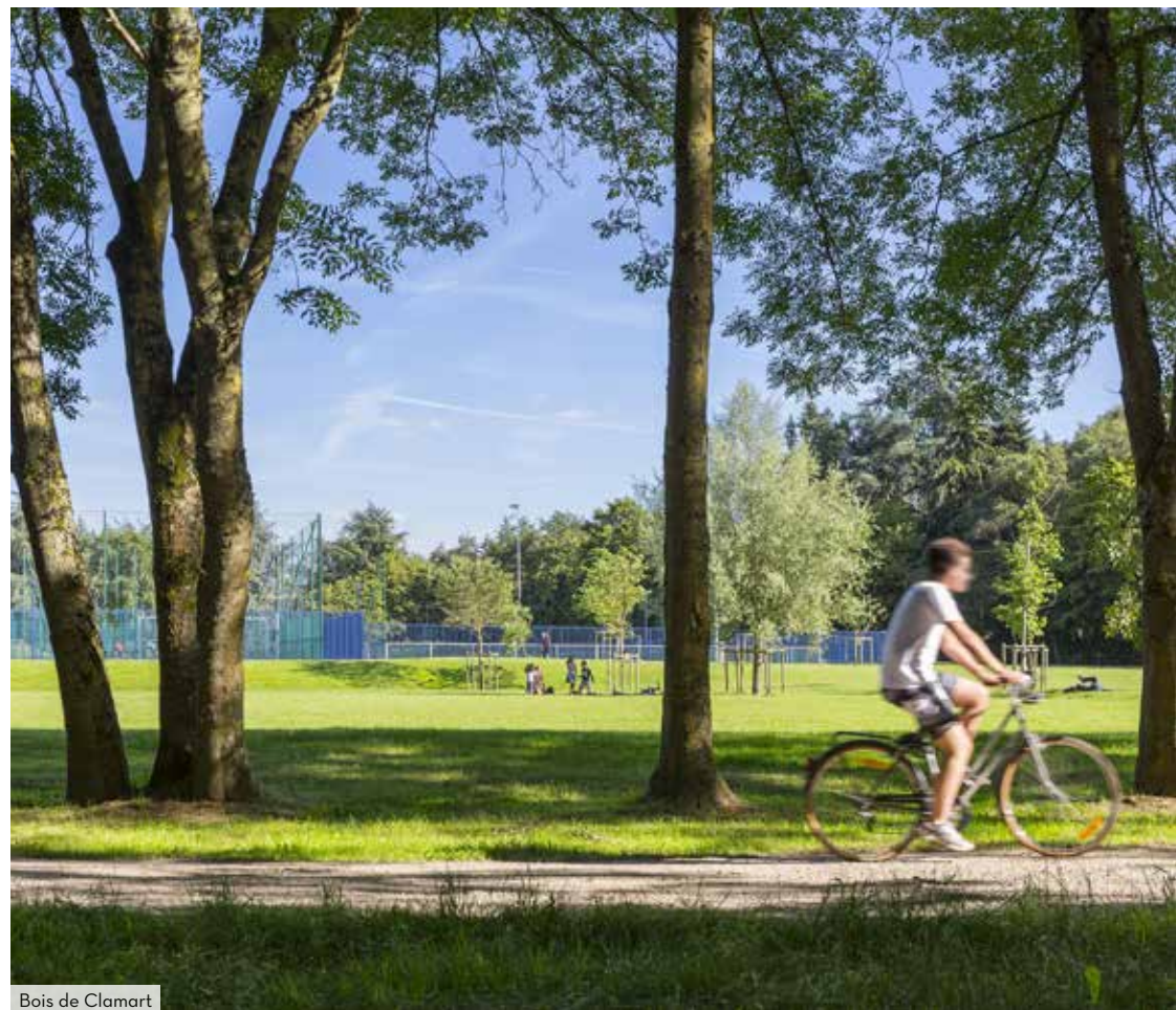
Bois de Clamart

Parfaitement accessible, Canal Square profite de 2 arrêts de tramway T6 et de plusieurs lignes de bus. Un emplacement parfait pour rejoindre Paris, le centre commercial de Vélizy 2 et d'autres grands pôles alentours. Il assure également un accès rapide à la N118 et à l'A86.