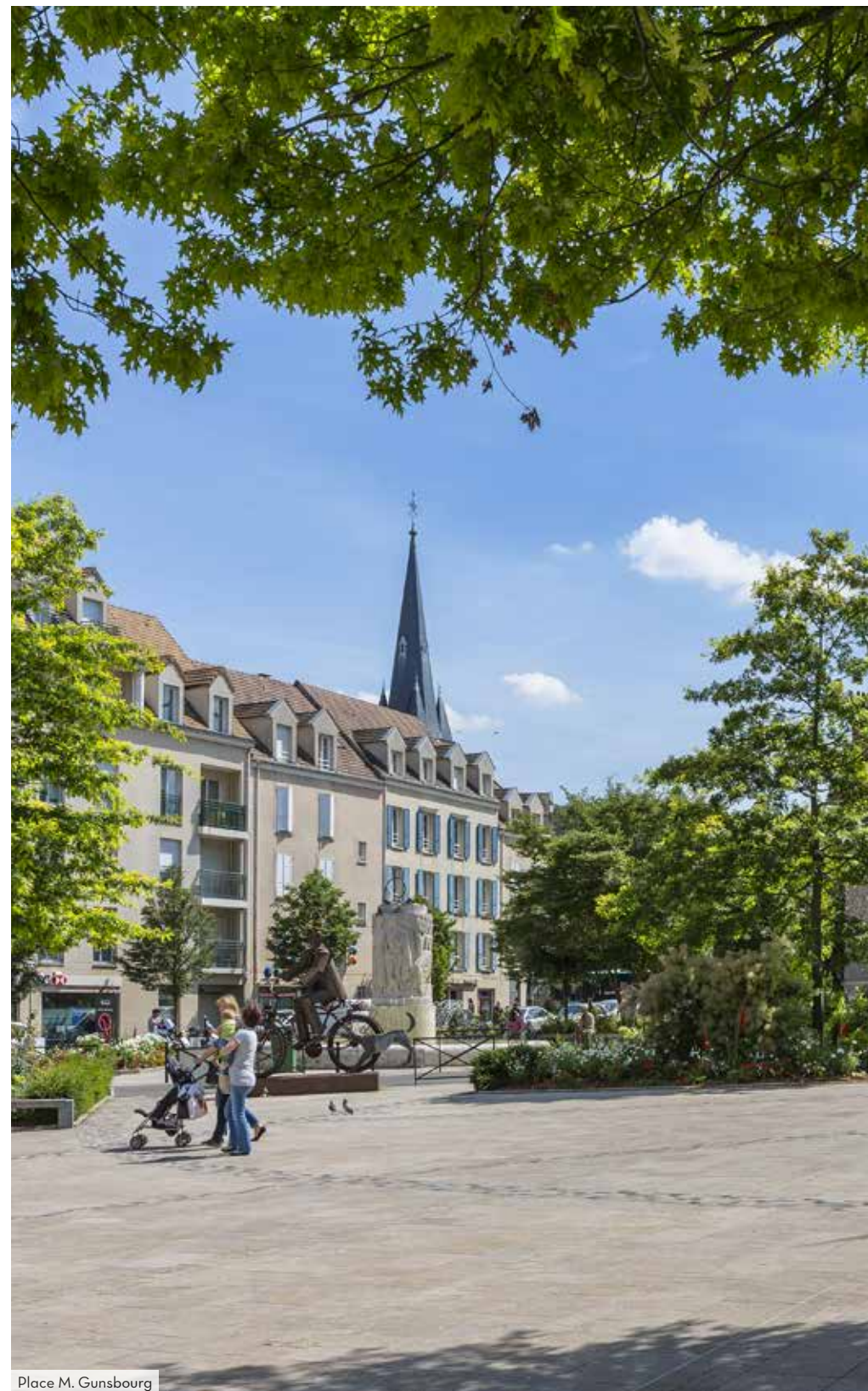
Place M. Gunsbourg