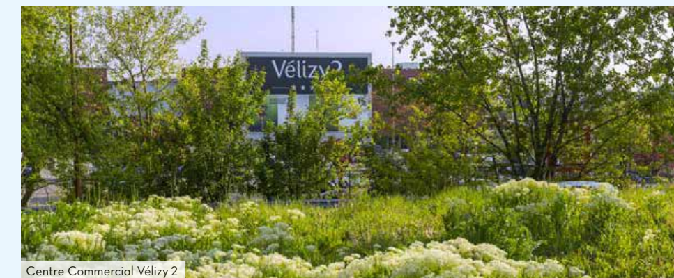
Centre Commercial Vélizy 2

Dans un esprit village, de nombreux jardins et espaces verts se mêlent à la forêt de Meudon et au bois de Clamart pour offrir plus de 1000 hectares de verdure ainsi que de belles promenades et pistes cyclables.